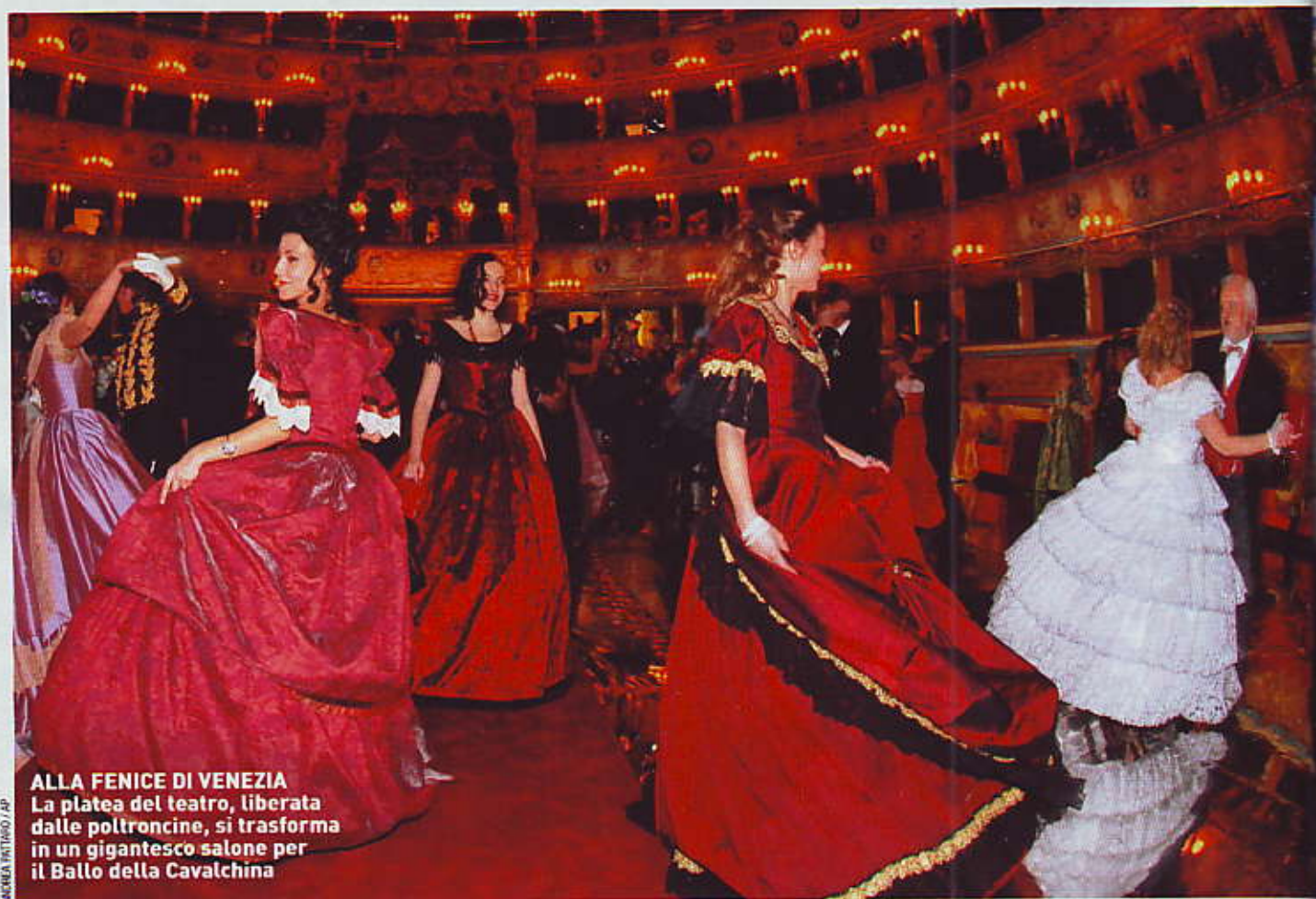
ALLA FENICE DI VENEZIA La platea del teatro, liberata dalle poltroncine, si trasforma in un gigantesco salone per il Ballo della Cavalcina