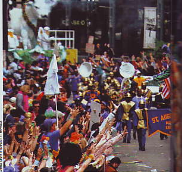
ALL'AMERICANA O COME SISSI I carri multicolori del carnevale di New Orleans. Sotto: il Gran Gala del Goff Hotel, con Sissi e Francesco Giuseppe

A Ivrea si balla incalzati da pifferi e tamburi, secondo la rievocazione di ballate ottocentesche: il 31 gennaio davanti al Municipio e il 2 febbraio in piazza di Città. Grande festa popolare (www.carnevaldiivrea.it) con grasse fagiolate (20 gennaio), e colossali coriandolare (4 febbraio). Dopo la lotta, notte romantica al Castello San Giuseppe (tel. 0125 424370), in collina: stanza per due a 150 euro, vista sul lago e colazione compresa. Ad Acireale (www.carnevaleacireale.com) sono i ballerini delle scuole ad aprire le danze che trasformano la piazza del Duomo in un'immensa sala sotto le stelle (1 e 5 febbraio). Poi, meritato riposo all'Hotel delle Terme, a due passi dal mare (70 euro in